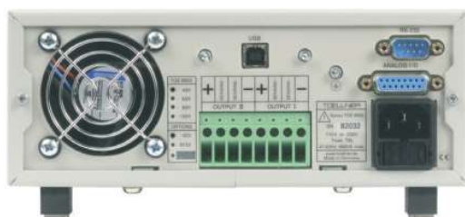
Geräterückseite Doppel-Netzgerät mit USB-Schnittstelle TOE 8952-Serie