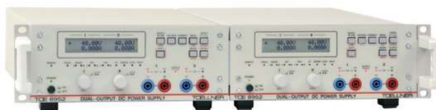
19"-Adapter, TOE 9522 2 HE, Parallelmontagesatz für 2 Geräte der Baureihe TOE 8950