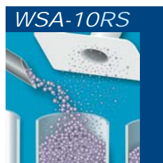
Staub und Rauch