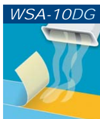
Gas, Geruch, Dämpfe